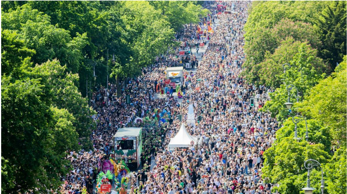
7- Karneval der Kulturen, Berliner Zeitung, 2023

Nous sommes remontés vers des horizons plus festifs le dimanche après-midi grâce au Karneval der Kulturen et son grand défilé à Kreuzberg. Pas facile de se retrouver parmi les milliers de personnes qui affluent pour voir défiler les chars et participants costumés, mais le spectacle en valait le déplacement (et le bain de foule).