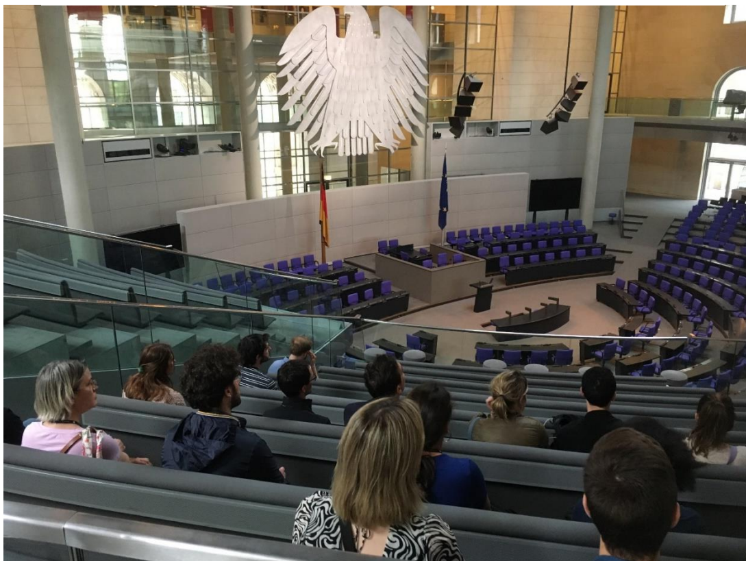
4- Dans la salle plénière du Reichstag