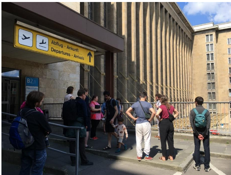
10- Visite guidée de l'ancien aéroport de Tempelhof

Lundi matin, dernière visite de groupe. Le week-end a commencé par une visite d'aéroport – et se finit également par une visite d'aéroport ! Cette fois, direction Tempelhof, dans l'ancien secteur américain, avec ses bâtiments d'une surface de 300 000 m 2 .