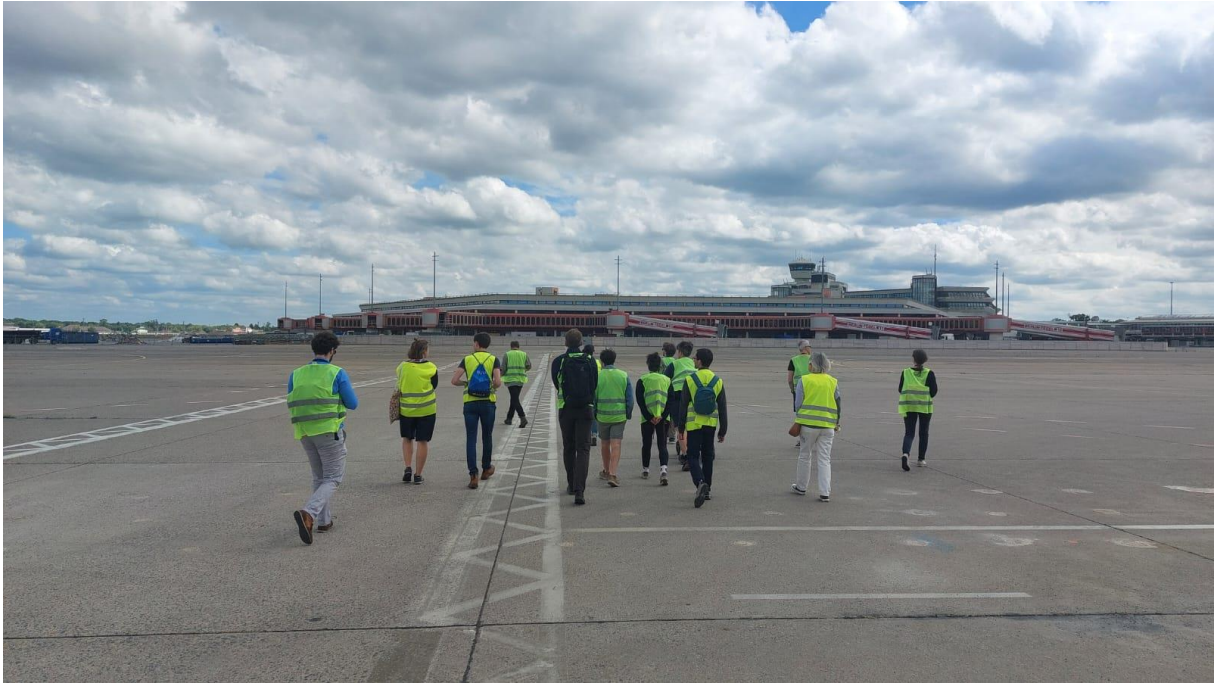
1- En arrière-plan, l'ancien terminal A de Tegel