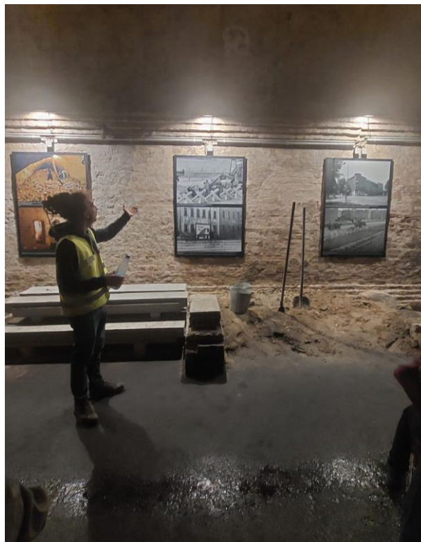
6- Berliner Unterwelten, tour M, Fuite sous le Mur

La matinée du dimanche fut largement consacrée au thème du Mur de Berlin. Un groupe est monté au Flakturm (tour de défense contre avions) de Humboldthain puis redescendu au musée en plein air de la Bernauer Straße, un site où le Mur séparait Berlin est et ouest en coupant le quartier en deux. Le deuxième groupe est descendu dans les sous-sols de Berlin au cours d'une visite guidée de l'association « Berliner Unterwelten » sur le thème des tunnels secrets et fuites sous le Mur de Berlin présentant les techniques créatives des deux côtés pour réussir ou empêcher le passage à l'Ouest.