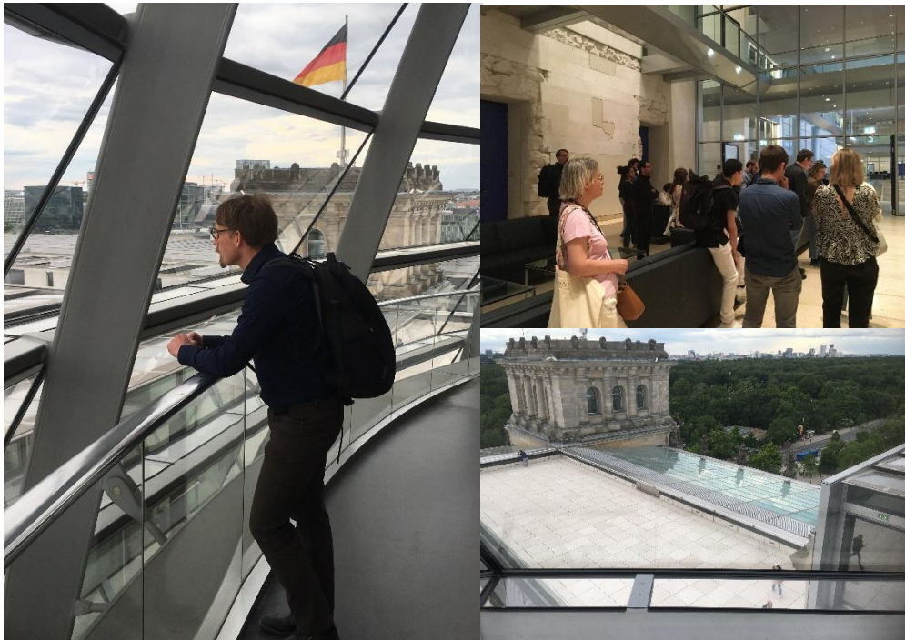
3- Visite du bâtiment du Reichstag

La visite de la capitale allemande se poursuit alors avec une visite guidée du bâtiment du Reichstag, le parlement allemand. Cette visite guidée est suivie d'une visite libre de la coupole du bâtiment, lieu conçu par Norman Foster pour les visiteurs, et qui offre une vue à 360° sur le bâtiment, la ville et sur la salle plénière en dessous.