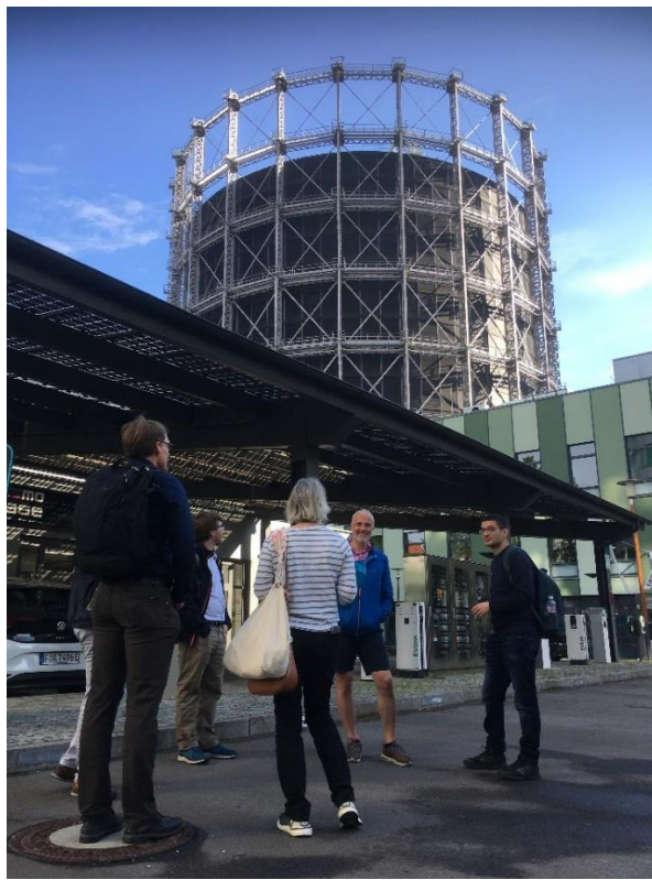
9- Euref-Campus, devant le Gasomètre transformé en bâtiment de bureaux

En fin d'après-midi, petite excursion au Euref-Campus, site accueillant de nombreuses entreprises du domaine de l'énergie et la mobilité, pour une visite de la chaufferie du campus. Cette chaufferie et centrale à froid assure le chauffage et la climatisation du quartier avec une puissance de chauffage de 4,7 MW ainsi qu'une puissance de climatisation de 2,0 MW (3,0 MW d'ici le 2 nd semestre 2024).