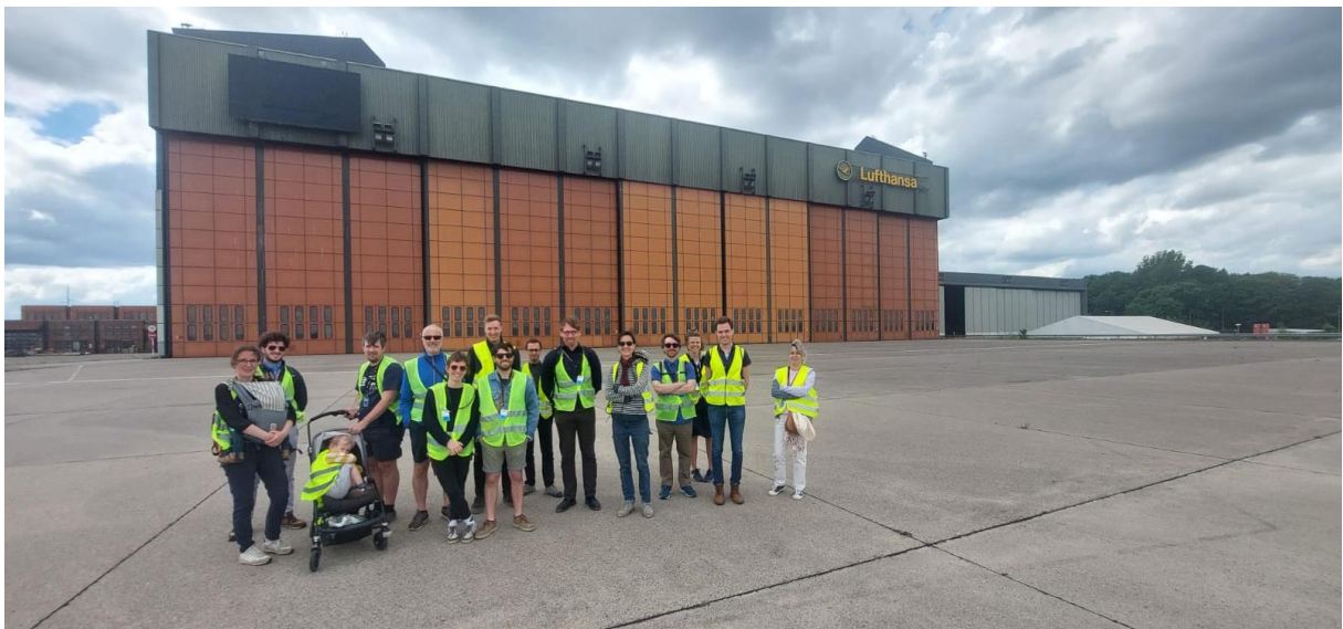
2- Devant le hangar British Airways et Lufthansa

Au déjeuner, le groupe se repose un moment à Hackescher Markt après un Döner au fameux Mustafa Kebab. Ensuite, certains poursuivent la journée au Futurium, exposition autour de la question « Wie wollen wir leben? » (Comment voulons-nous vivre ?), tandis qu'un petit groupe part pour une balade au centre-ville, via l'île aux Musées, Alexanderplatz, Unter den Linden, pour arriver devant le Reichstag en fin d'après-midi.