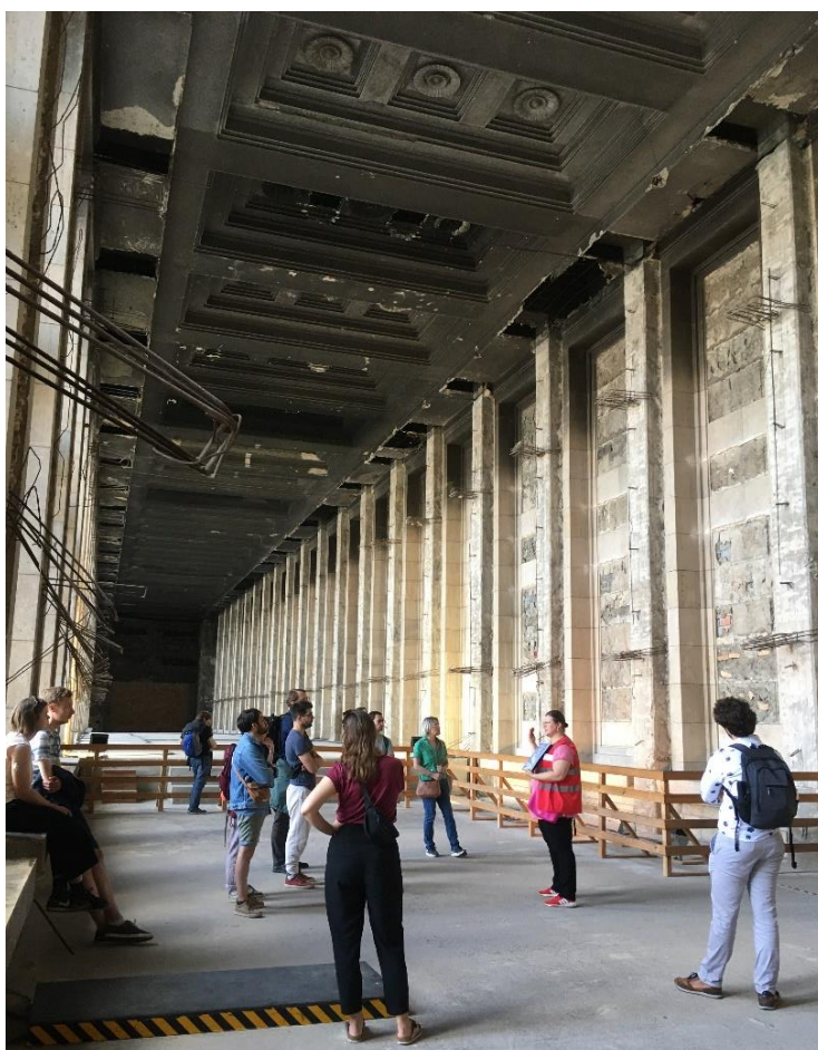
12- Tempelhof, dans l'ancienne entrée monumentale, coupée en 2 étages après la seconde guerre mondiale

Merci à tous les participants (accompagnants majeurs et mineurs inclus !) pour leur participation à la RICSА de Berlin ! Nous remercions également les associations des Ecoles Centrales pour avoir contribué au financement de cette rencontre.