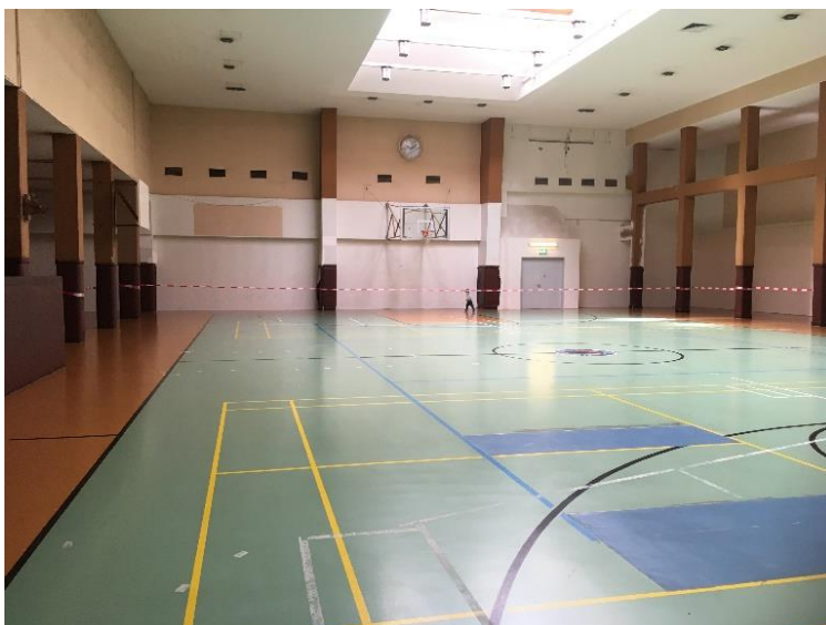
11- Tempelhof, salle de bal reconvertie en terrain de sport par les forces d'occupation américaines