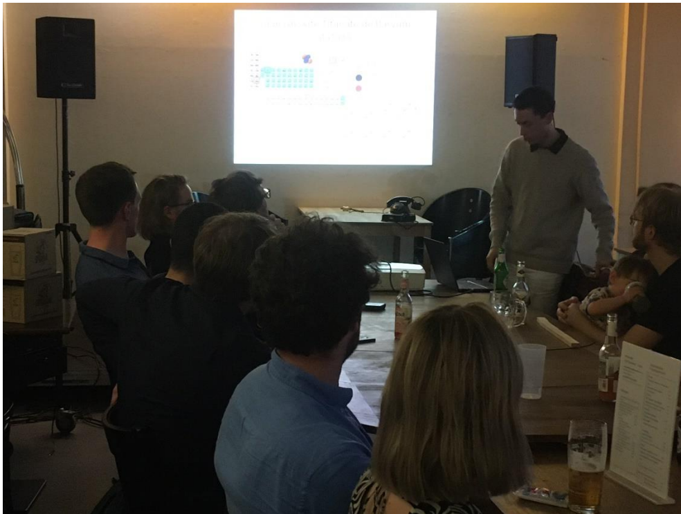
5- Sujet de thèse sur les nanostructures de baryum, soirée au Café Madame

La matinée du dimanche fut largement consacrée au thème du Mur de Berlin. Un groupe est monté au Flakturm (tour de défense contre avions) de Humboldthain puis redescendu au musée en plein air de la Bernauer Straße, un site où le Mur séparait Berlin est et ouest en coupant le quartier en deux. Le deuxième groupe est descendu dans les sous-sols de Berlin au cours d'une visite guidée de l'association « Berliner Unterwelten » sur le thème des tunnels secrets et fuites sous le Mur de Berlin présentant les techniques créatives des deux côtés pour réussir ou empêcher le passage à l'Ouest.