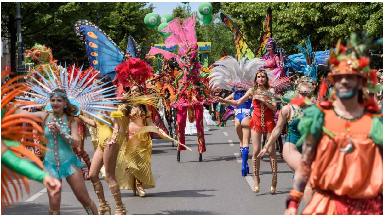
8- Karneval der Kulturen, deutschlandkultur.de, 2024